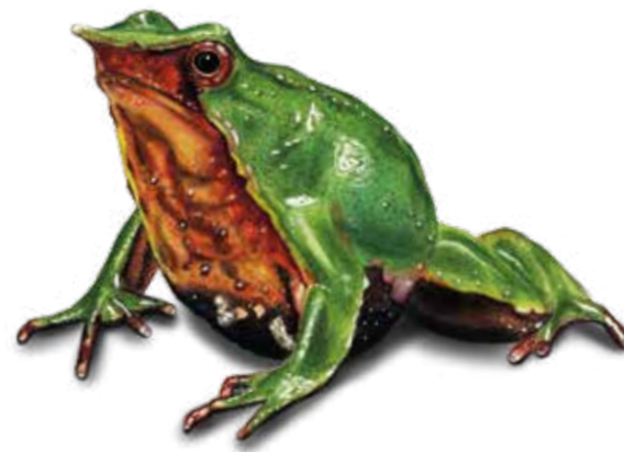
EN Ranita de Darwin Rhinoderma darwini