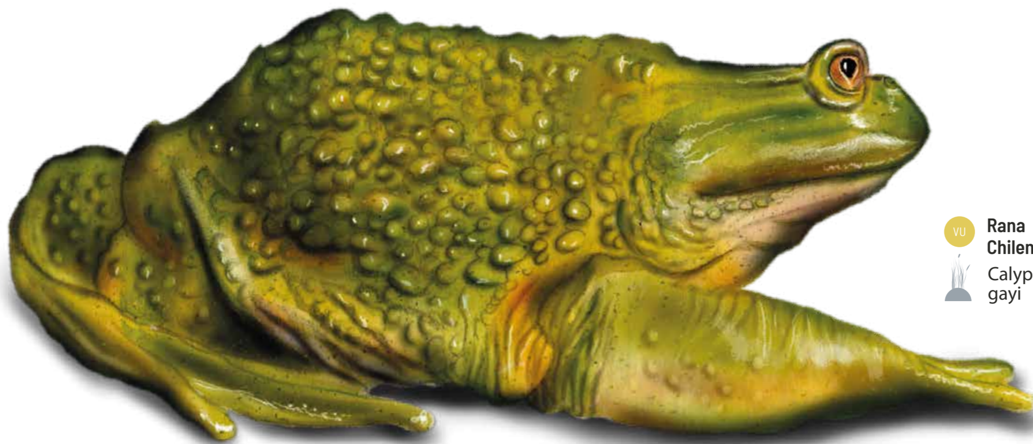
VU Rana Chilena Calyptocephalella gayi