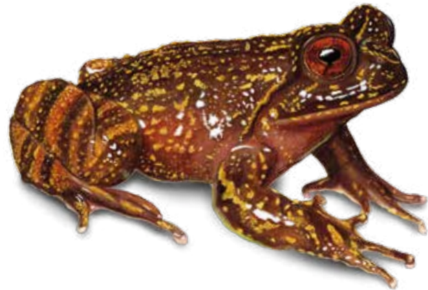
EN Rana de Mehuín Insuetophrynus acarpicus