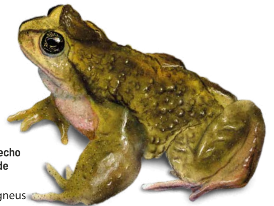
VU Rana de Pecho Espinoso de Tolhuaca Alsodes igneus