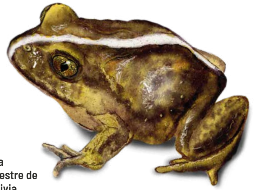
VU Rana Terrestre de Valdivia Eupsophus vertebralis