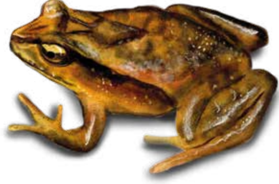
LC Rana de Hojarasca Austral Eupsophus calcaratus