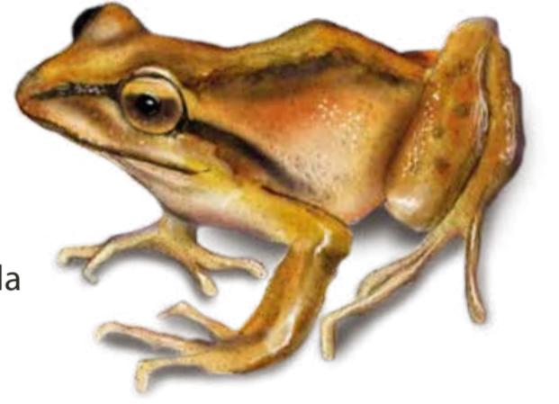
NT Ranita de Antifaz Batrachyla taeniata