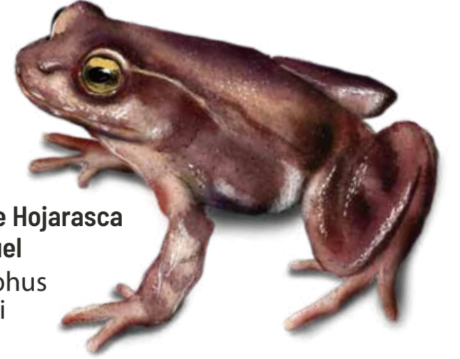
EN Rana de Hojarasca de Miguel Eupsophus migueli