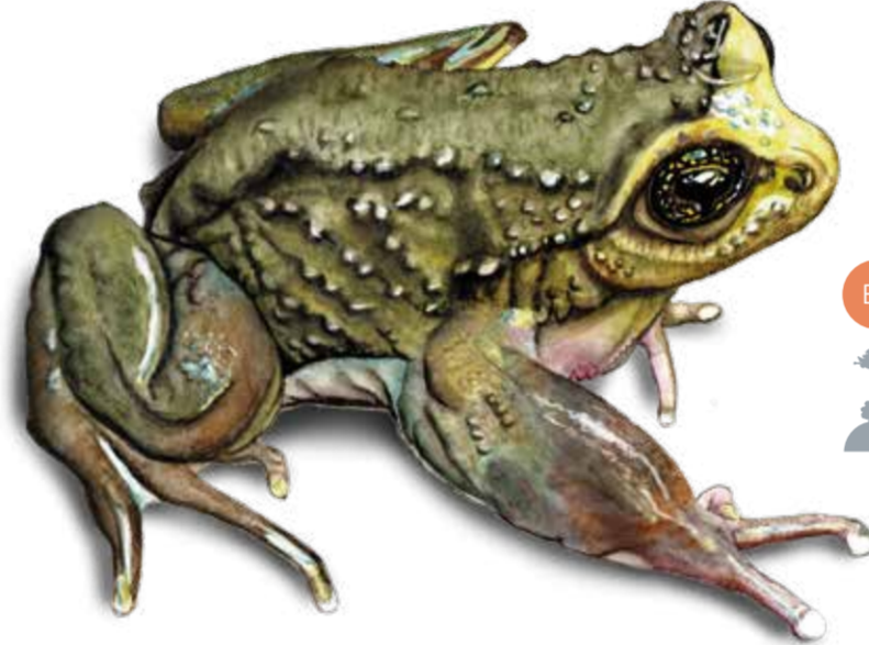
EN Rana de Pecho Espinoso de Verrugas Alsodes verrucosus