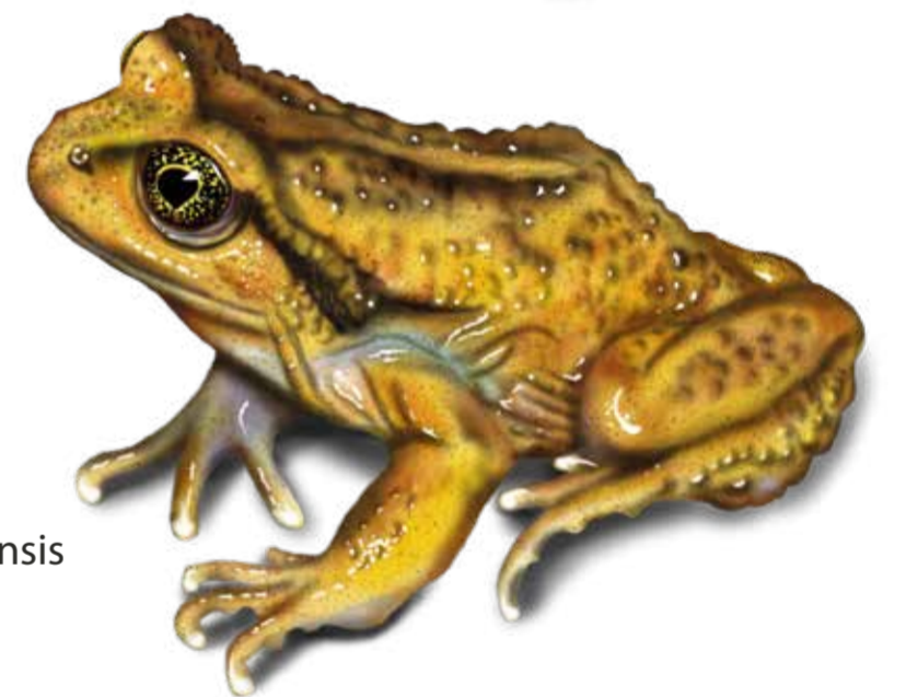
EN Rana de Pecho Espinoso de Cordillera Pelada Alsodes valdiviensis