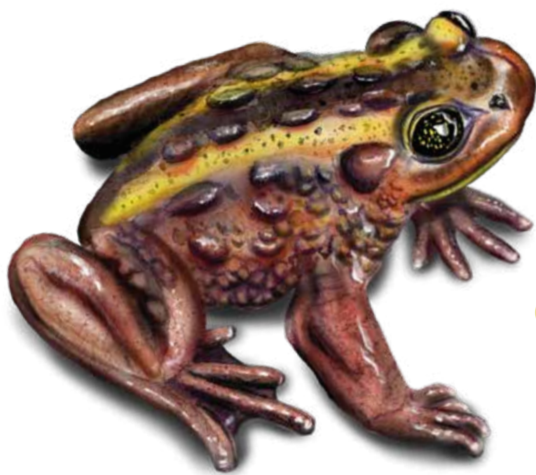
VU Sapo Austral Telmatobufo australis