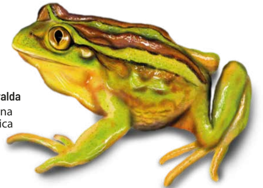
LC Rana Esmeralda Hylorina sylvatica