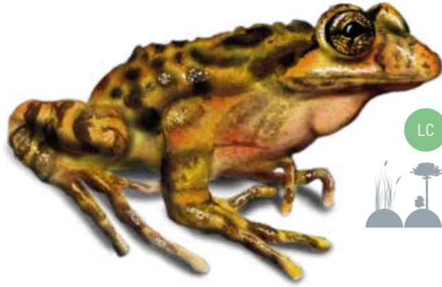
LC Rana Jaspeada Batrachyla antartandica