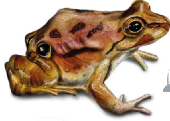
NT Sapito de Cuatro Ojos Pleurodema thaul