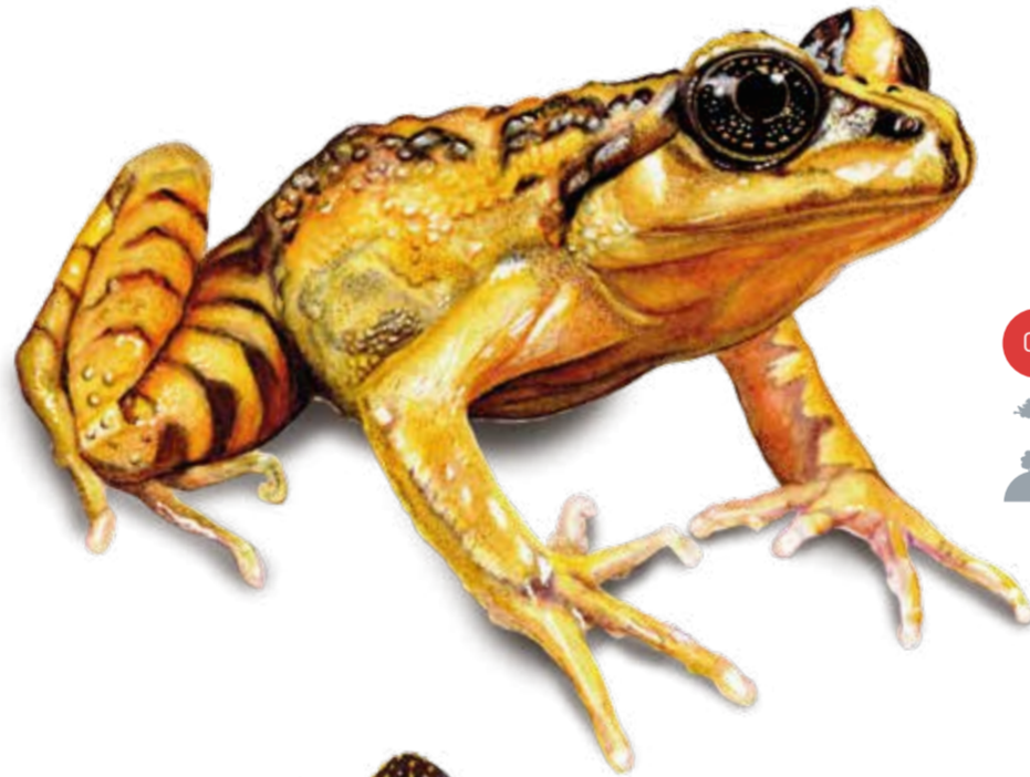
CR Rana de Pecho Espinoso de Oncol Alsodes norae