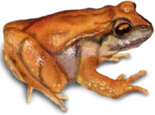
VU Rana de Hojarasca Rosácea Eupsophus roseus