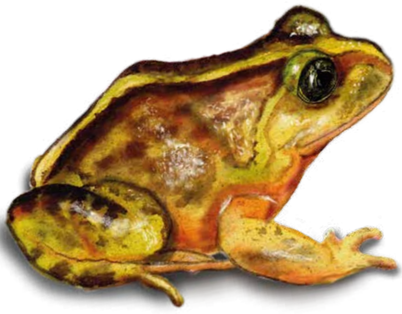
LC Rana de Hojarasca de Párpados Verdes Eupsophus emiliopugini