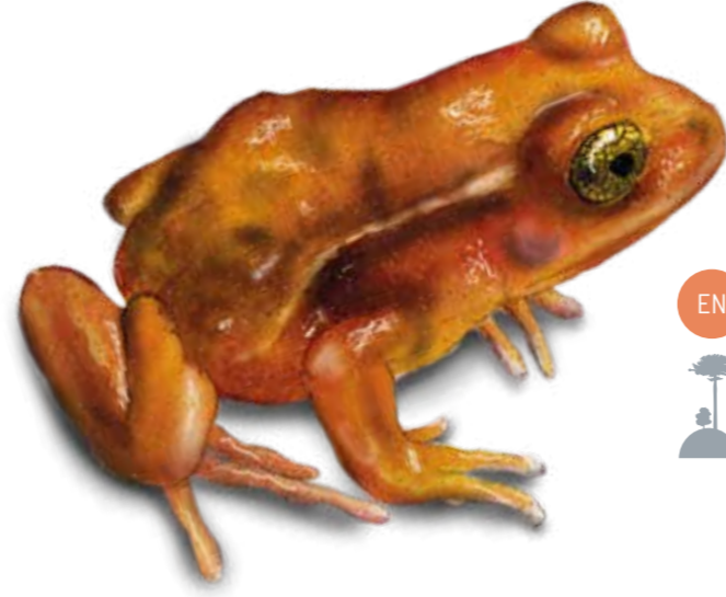
EN Rana de Hojarasca de Oncol Eupsophus altor